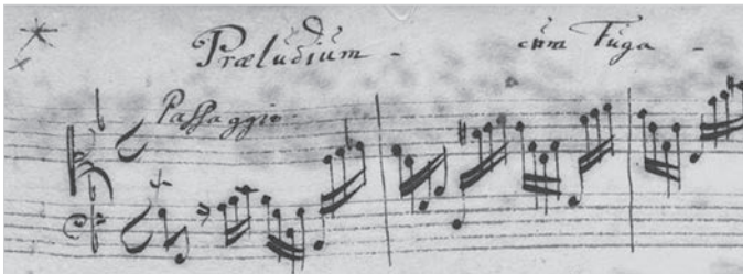
Abbildung 1: Möller-Manuskript, f. 44r, Beginn von BWV 535.

Der Begriff des Passaggio im Sinne von »geschwinde Läufe« 7 für den improvisatorischen Einstieg in das Präludium lässt sich bei Buxtehude selbst nicht nachweisen, tritt jedoch beim jungen Johann Sebastian Bach auf. In der sog. Möller'schen Handschrift aus der Zeit um 1705 8 findet sich unter den wenigen erhaltenen frühen autographen Niederschriften Bachs die Aufzeichnung des Präludiums in g (BWV 535). Dort trägt die ausgedehnte einstimmige manualiter -Passage zu Beginn des Werkes, die mit dem pedaliter -Akkord in Takt 7 ihren Abschluss findet, von der Hand Bachs die Bezeichnung »Passaggio« (Abb. 1):