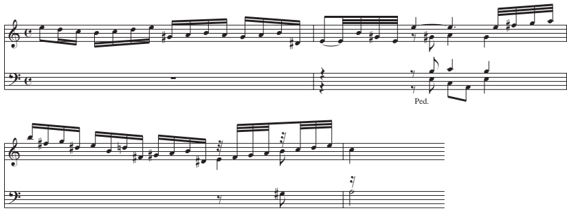
Notenbeispiel 1a: BuxWV 152, Passaggio zu Beginn

Der Begriff des Passaggio im Sinne von »geschwinde Läufe« 7 für den improvisatorischen Einstieg in das Präludium lässt sich bei Buxtehude selbst nicht nachweisen, tritt jedoch beim jungen Johann Sebastian Bach auf. In der sog. Möller'schen Handschrift aus der Zeit um 1705 8 findet sich unter den wenigen erhaltenen frühen autographen Niederschriften Bachs die Aufzeichnung des Präludiums in g (BWV 535). Dort trägt die ausgedehnte einstimmige manualiter -Passage zu Beginn des Werkes, die mit dem pedaliter -Akkord in Takt 7 ihren Abschluss findet, von der Hand Bachs die Bezeichnung »Passaggio« (Abb. 1):