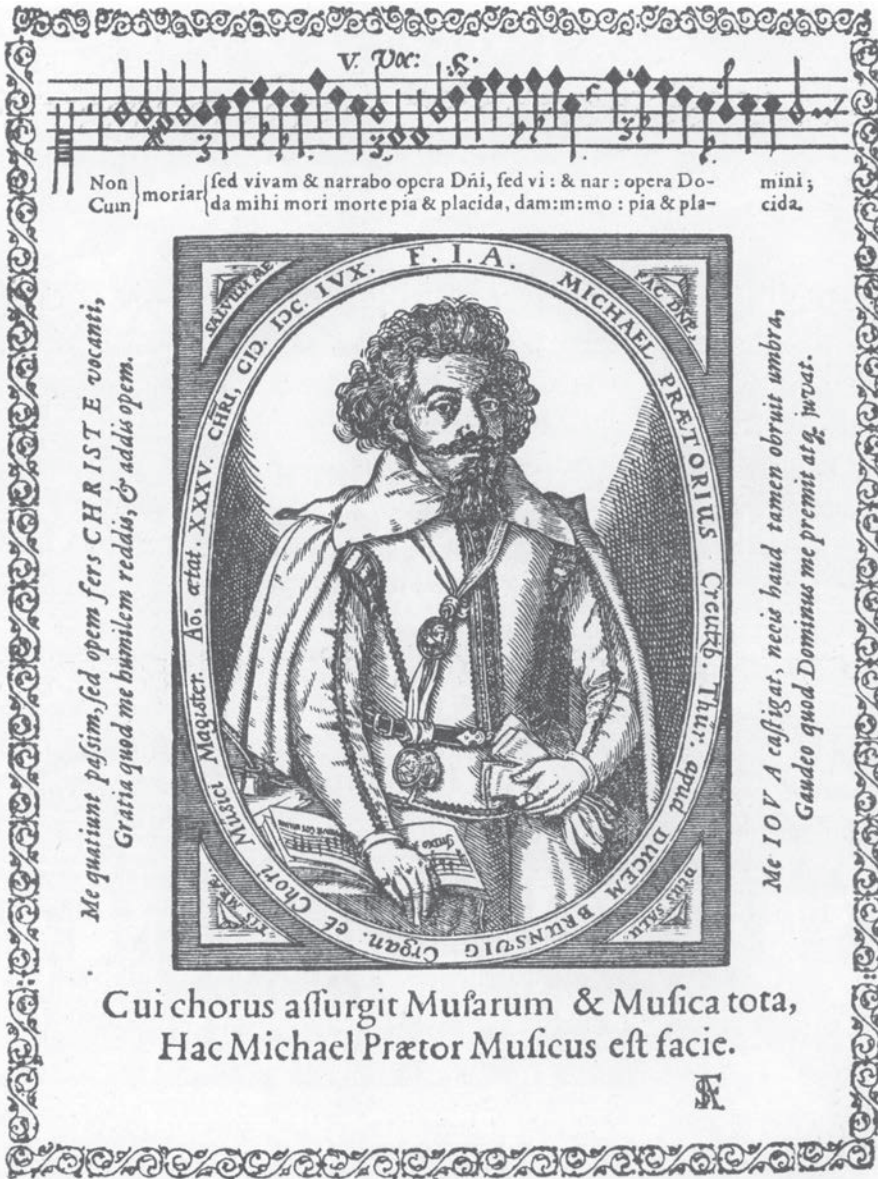
Holzschritt B: Generaltitelblatt Musae Sioniae , 1606 Portraitholzschritt als Frontispiz (Abb. 2)