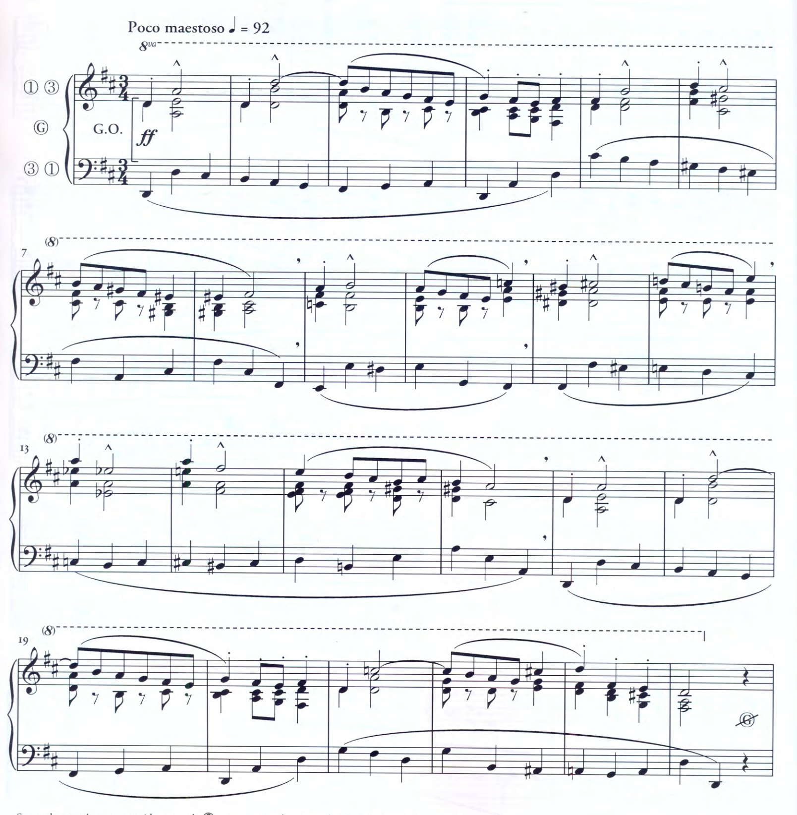
Sur un harmonium ne possédant pas de ②, ou un orgue dépourvu de 16 pieds, ne pas tenir compte des &.